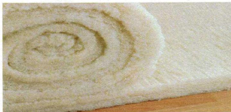
Balkendichtung DWL 5/40