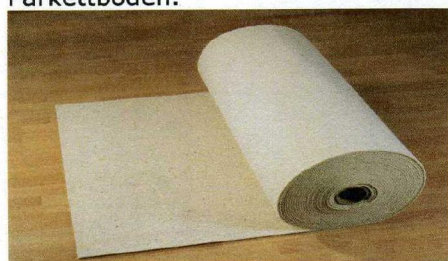
Trittschall Dämmfilz DFB 5/3

als Trittschalldämmung zwischen Blindboden und Naturholz- oder Parkettboden.