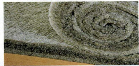
Balkendichtung DWS 8/40