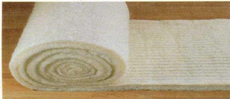
Balkendichtung DWL 5/40

Blockhausdichtung in Steifenform in gewünschter Breite und Stärke Je nach Stärke der Blockbalken (Kant- oder Rundbalken) können wir sämtliche Dichtstreifenbreiten z.B. 5 - 40 cm Breite und 5-100 mm Stärke bzw. Höhe liefern.