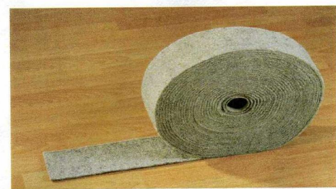
Trittschall Dämmfilzstreifen DFS 8/5

als Trittschalldämmung für Holzbalken im Boden und Decken