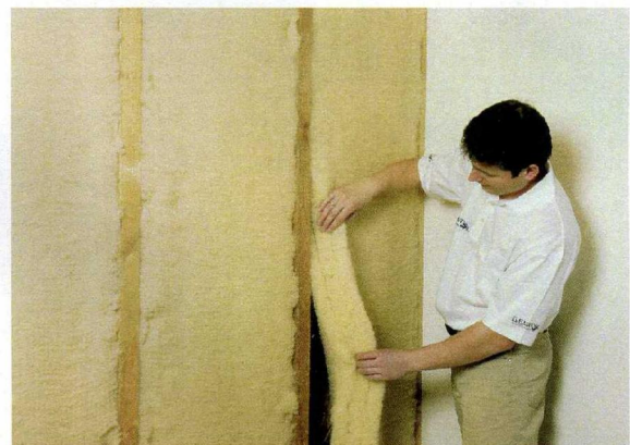
Schafwoll-Dämmmatte DWS 12/60