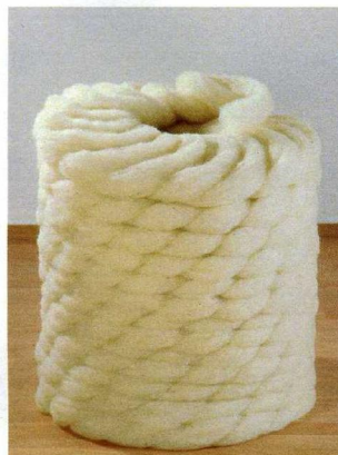
Dämmzopf DWZ 5

zum ausfüllen und abdichten von Hohlräumen Fenster und Wand, Tür und Wand, sowie allen Holzverbindungen und Zwischenräumen.