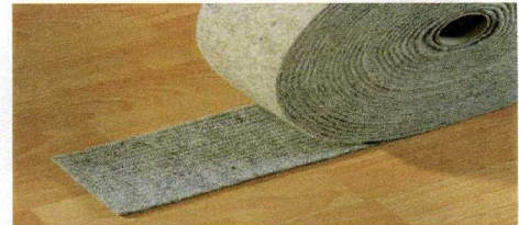
Balkendichtung DFS 8/5