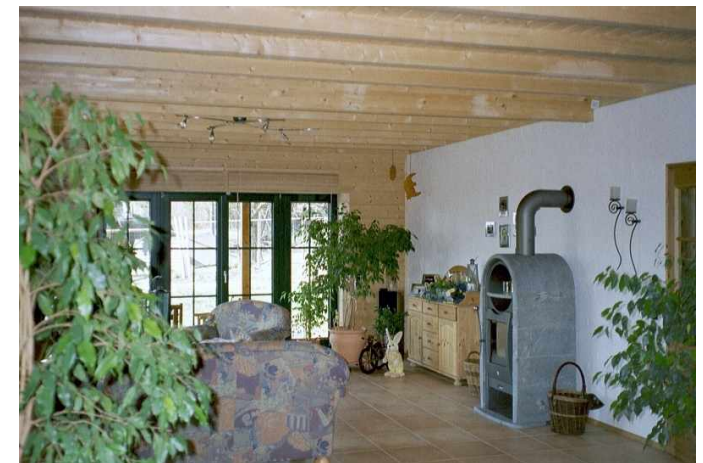
Verputzte Innenwand im Kontrast zum Massivholz